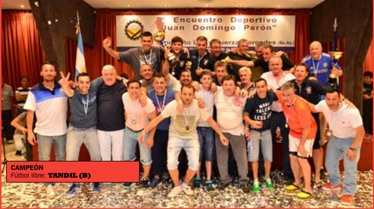
CAMPEÓN Fútbol libre: TANDIL (B)