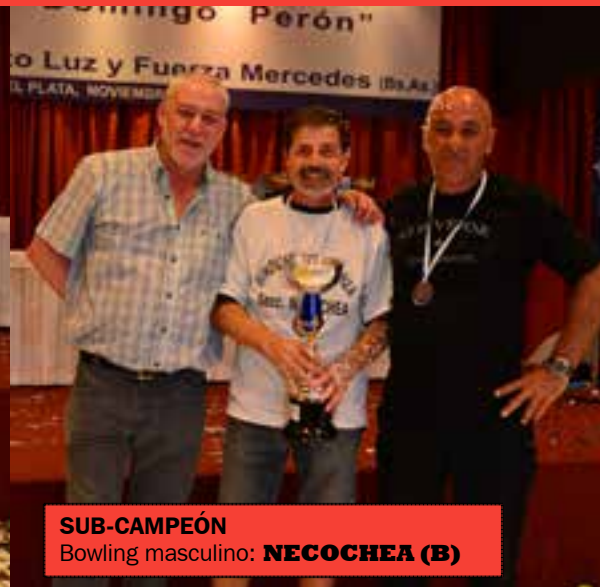
SUB-CAMPEÓN Bowling masculino: NECOCHEA (B)