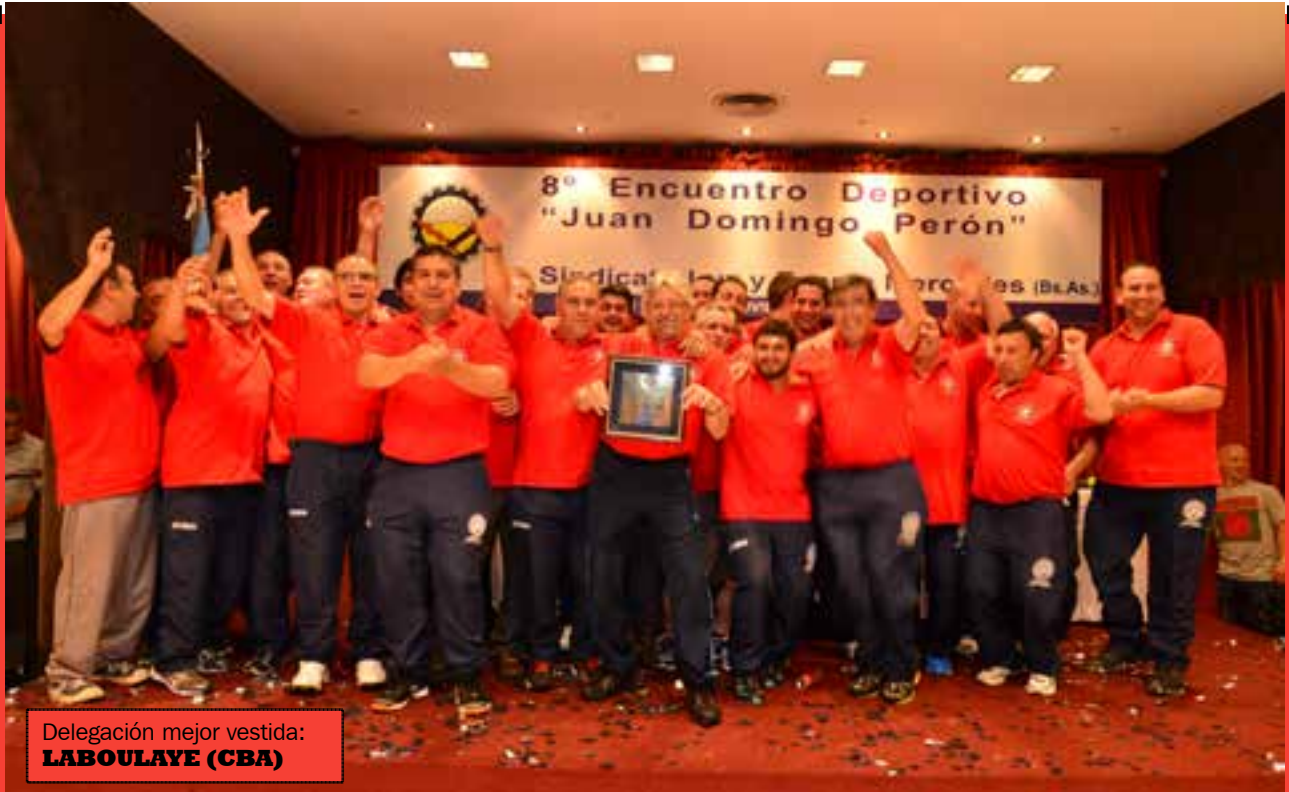
Delegación mejor vestida: LABOULAYE (CBA)