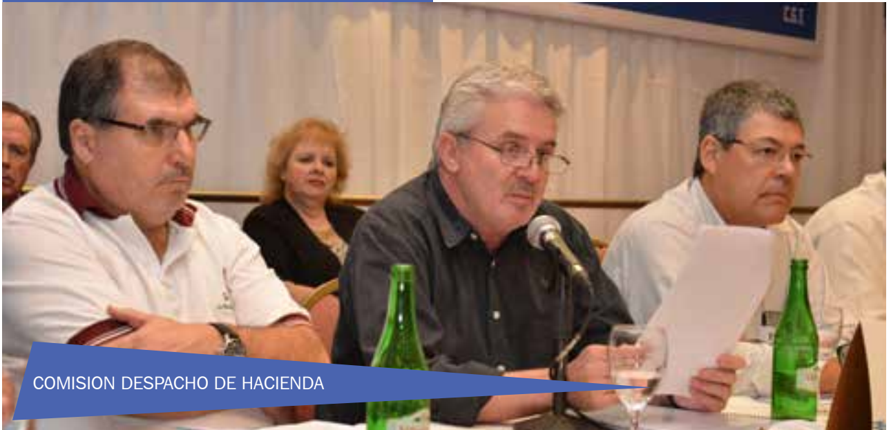
COMISION DESPACHO DE HACIENDA