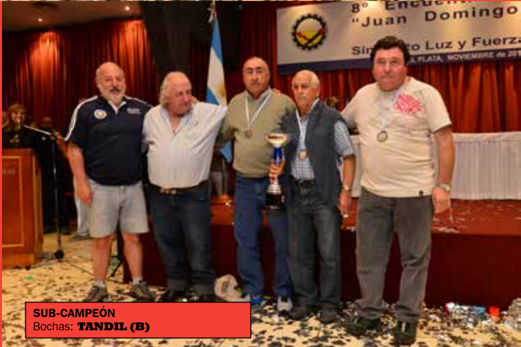
SUB-CAMPEÓN Bochas: TANDIL (B)