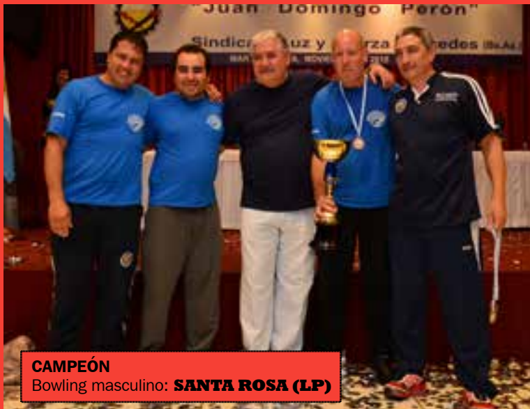
CAMPEÓN Bowling masculino: SANTA ROSA (LP)