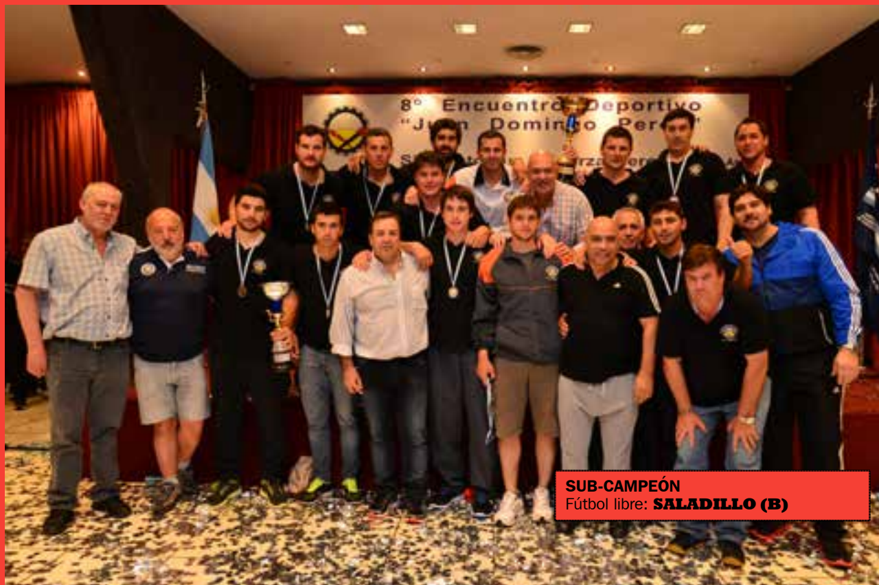
SUB-CAMPEÓN Fútbol libre: SALADILLO (B)