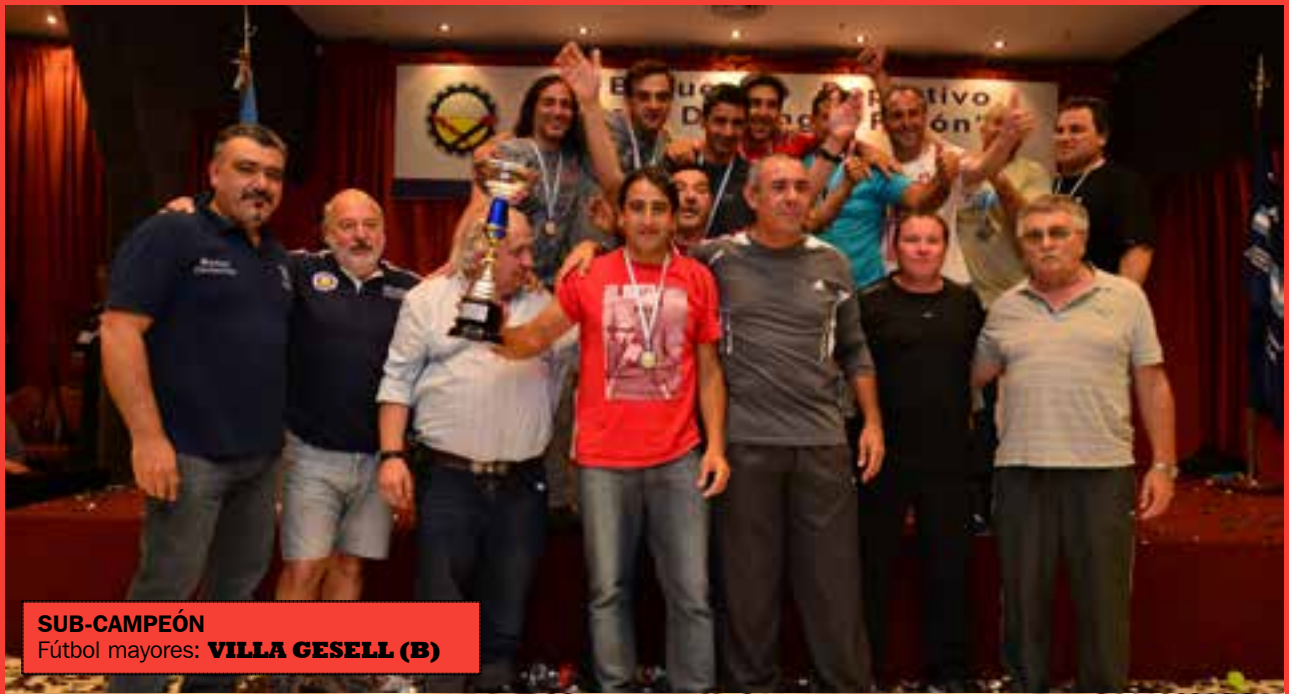
SUB-CAMPEÓN Fútbol mayores: VILLA GESELL (B)