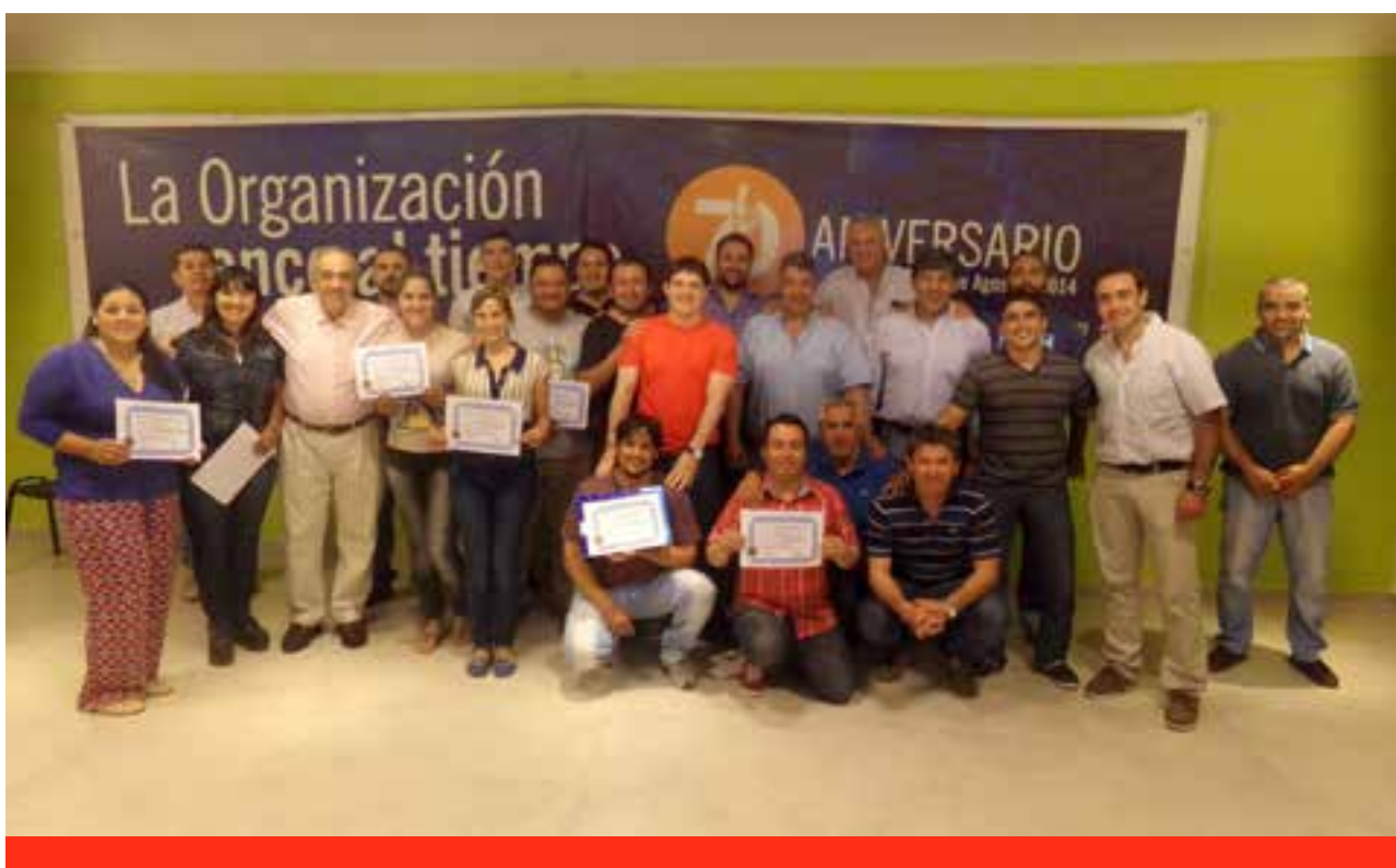
CURSO DE ORATORIA Y COMUNICACION QUE SE REALIZO EN LA SECCIONAL RESISTENCIA - CHACO, EN LOS DIAS 28, 29 Y 30 DE SETIEMBRE 2015.