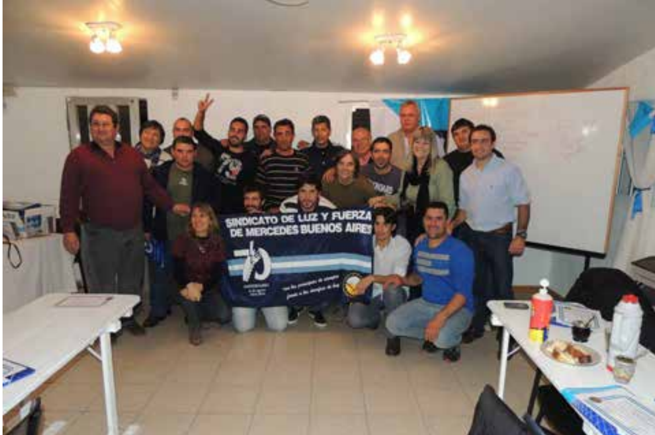
CURSO TRENEL de Negociación y Conflicto, realizado desde el 22 al 24 de junio 2015.