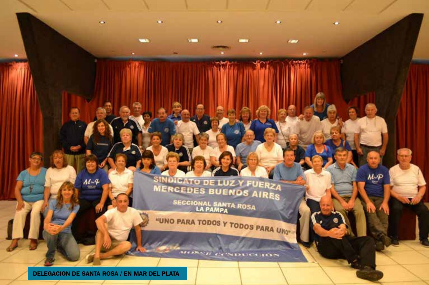
DELEGACION DE SANTA ROSA / EN MAR DEL PLATA