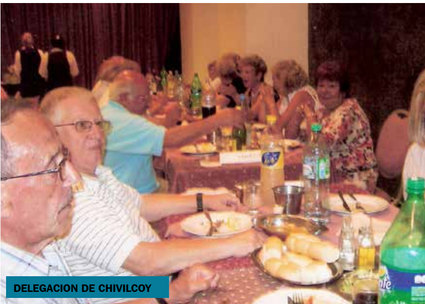
DELEGACION DE CHIVILCOY