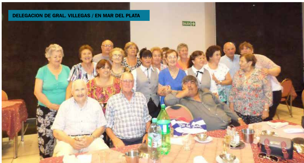
DELEGACION DE GRAL. VILLEGAS / EN MAR DEL PLATA