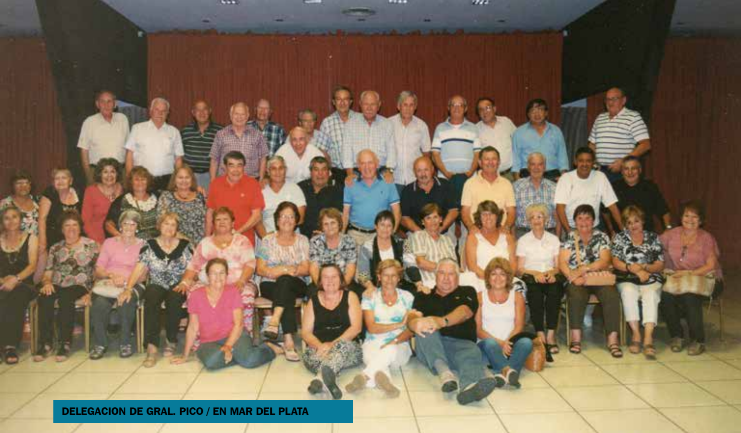
DELEGACION DE GRAL. PICO / EN MAR DEL PLATA