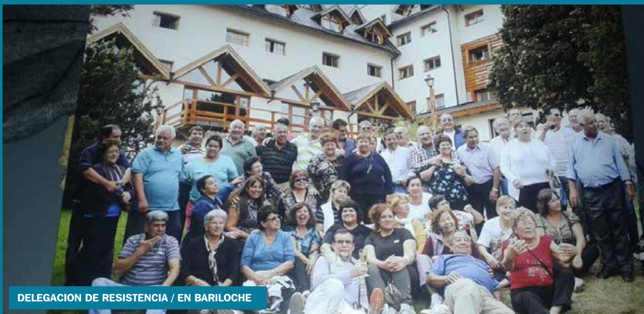
DELEGACION DE RESISTENCIA / EN BARILOCHE

Durante el verano de este año, se realizaron contingentes de jubilados gratuitos, a distintos hoteles de nuestro País. En este número damos a conocer el listado de los Compañeros que han viajado hasta ahora, por razones de espacio en nuestra revista publicaremos algunas fotos de los contingentes, en revistas sucesivas lo haremos con el resto.