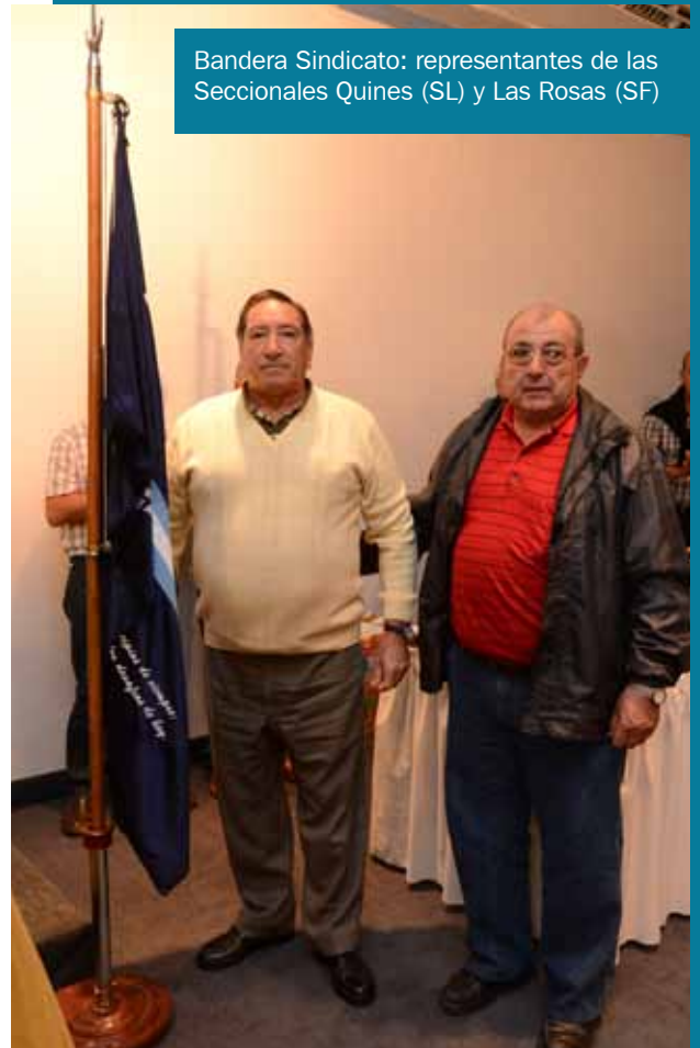
Bandera Sindicato: representantes de las Seccionales Quines (SL) y Las Rosas (SF)