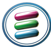
ROBERTO IRIBARNE producción de imagen y sonido